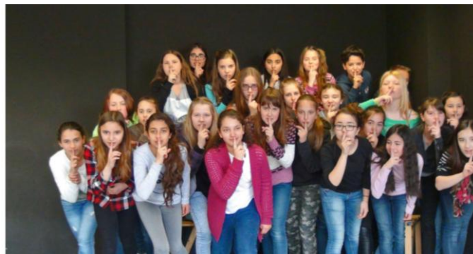
Standbild zum Thema: „Getuschel“ von Jürgen Spohn

Wir treten auf und präsentieren unsere Ergebnisse öffentlich, auch vor Publikum!