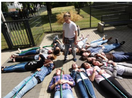
Projekt: Der Panther – Gedichte szenisch darstellen