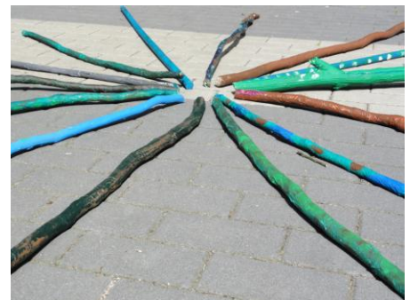
Projekt Panther: Requisiten - Naturstäbe gestalten