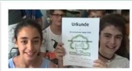
Mülldetektiv und Waldabenteurer