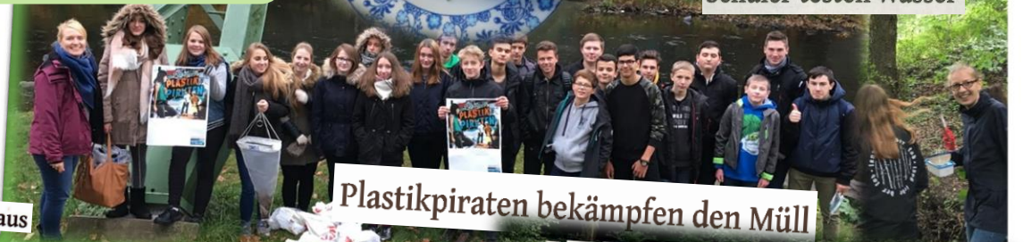
Schüler testen Wasser