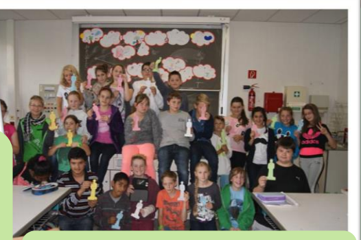
2014: Projekt „Warm Up“ zum nachhaltigen Umgang mit Wärmeenergie