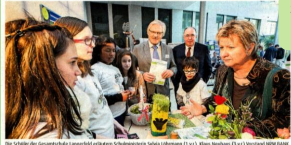
Schulbücher in upgecycelter Box, umweltfreundliche Schulmaterialien im öko-logisch! Shop