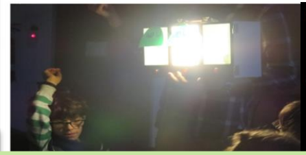
2016: Upcycling, Picobello-Tage, Energiedetektive und Entwicklung von Energiesparstickern...