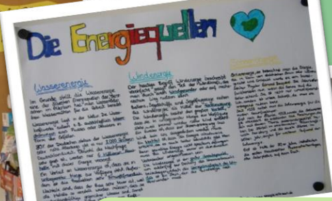
2013: Erneuerbare Energien, Besuch eines Wärmeberaters und Wandzeitung zum Energiesparen